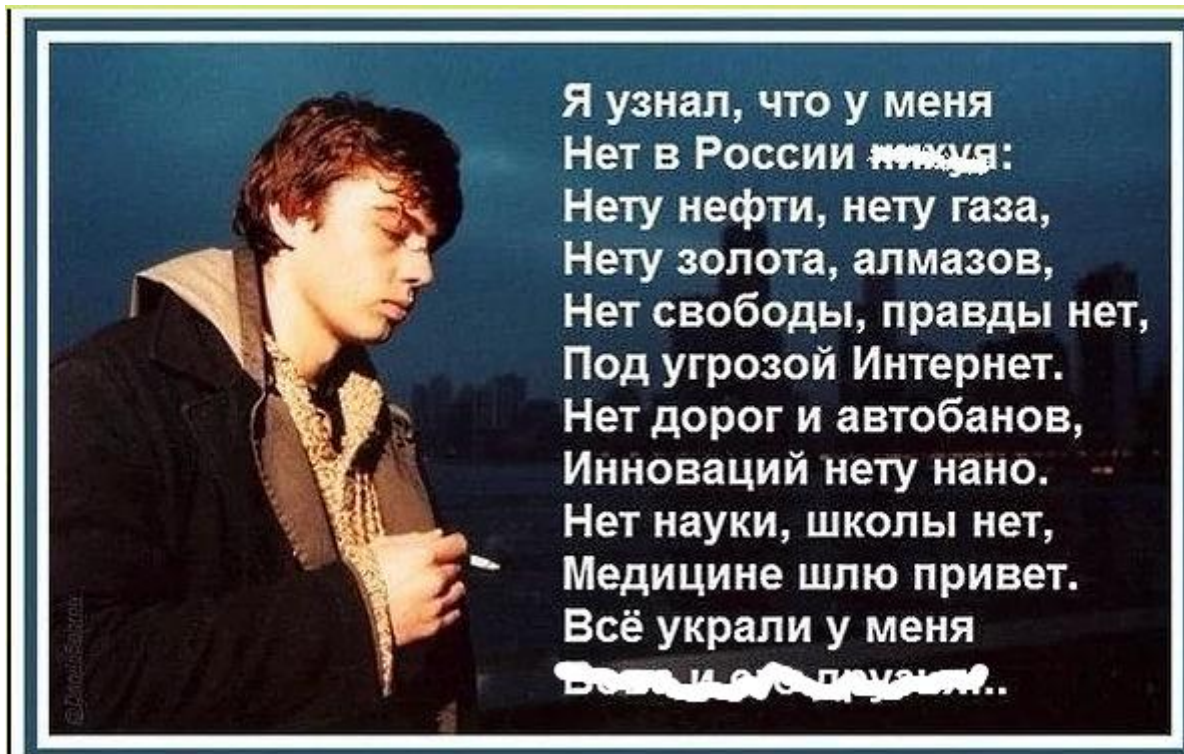
Рис.3. Цифровую реализацию «Серегиногового» плана смотри в докладе Мишутина.

Четвёртый пункт. Первые три пункта якобы вообще нас не касаются – они «удел» (собственность) мафиозного клана, осуществившего рейдерский захват Кремля (рис.3).