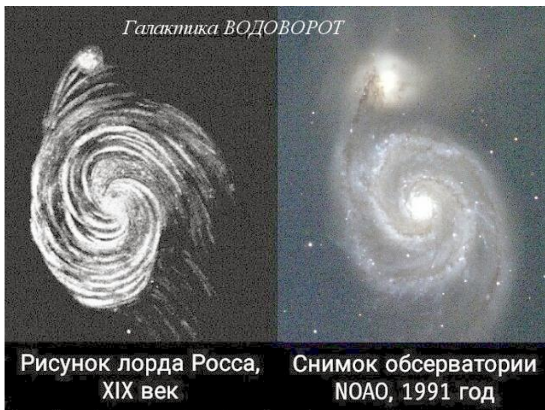
Рис.1 «Всё течёт, всё меняется, но кое-что остаётся»

многих интересует. С многочисленными ежедневными моими комментариями ситуация несколько схожа с моей речью, обращённой к решившимся проволынить работягам. И то, что гнилой «интеллигенции», для которой более привычно брюзжание на кухне (о том, какие они несчастные, по разным признакам) и фига в кармане (спрятанная так хорошо, что посторонний взгляд и не заподозрит), и то, что дебилам, привыкшим оставлять после себя в интернете лишь грязный след, запахло «выслушивать» мои резкие комментарии и под ними они часто ставят много отрицательных лайков, я воспринимаю положительно. Это-то и означает, что мне удалось достучаться до остатков их разумности и это радует. Тем более, что как раз после такого активного «отрицания» и вижу резкий рост/скачок читаемости своих статей. И что уж точно не перепутаешь – часто скачок читаемости именно научных и технических с формулами и графиками. Ну и конечно слежу за тем, как «отрабатывает» идеи моих статей академическая и государственная бюрократия. Здесь дело пока швах – сплошные извращения и имитация деятельности. Но идущее им на смену поколение что-то да почерпнуло из моих статей. И иногда эти в прямом смысле ребята, но уже включившиеся в политику, присылают мне открытки на праздник. Но организационным делам я уже отдал достаточно времени. А вот в решении ПРОБЛЕМ могу помочь очередной статьёй или комментарием.