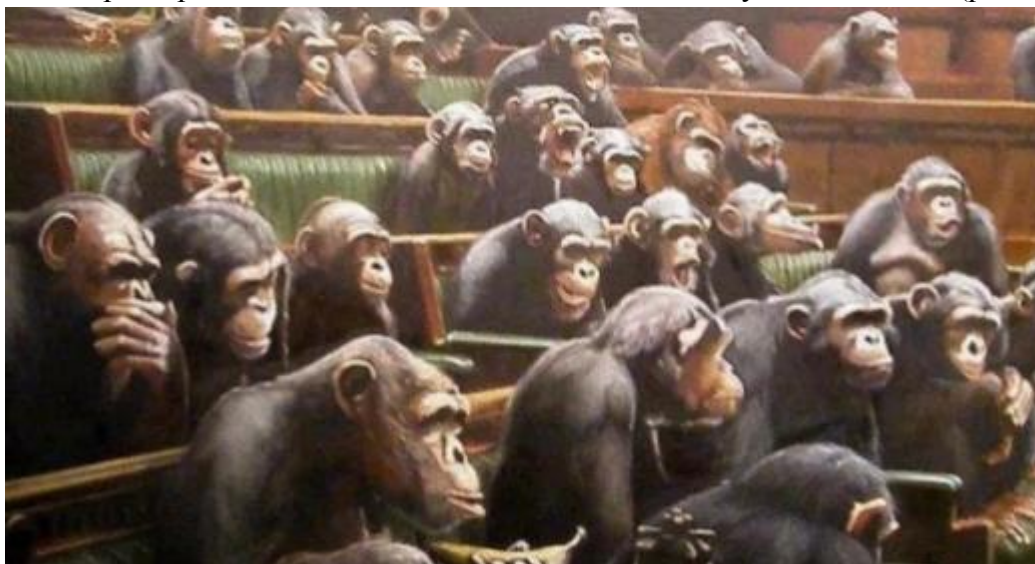
Рис.2. Рентгеновский снимок «королей».

просматриваются без особого усилия под любыми нарядами «слуг народа», для которых как раз народ и есть просто слуги. Дело в Закулисе, которая, как ни создаёт вокруг себя ореол загадочности, манипулируя даже Образом Президента, шерсть и шкурные рефлексy которой проглядывают и сквозь любые «интеллектуальные одежки» (рис.2).