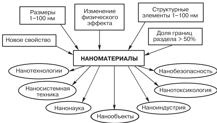
Рис. 1.1. Некоторые отличительные свойства наноматериалов и области их применения

За последние 10 лет только в России было проведено большое количество конференций, на которых особое внимание уделялось классификации и терминологии в области изучения и применения малоразмерных объектов (рис. 1.1). Если к этому вопросу подходить системно, то в определении необходимо отразить основные характерные свойства объекта или явления. В качестве таковых, на-